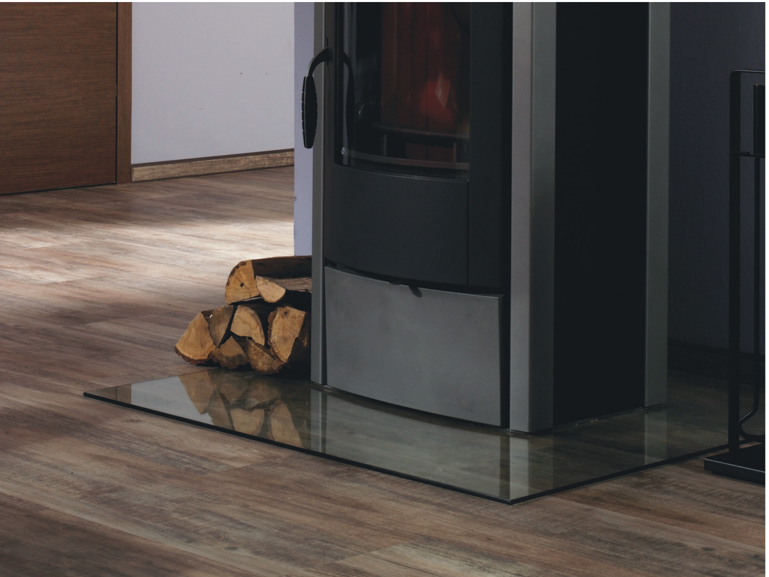
VINYL DESIGN - Birke gealtert